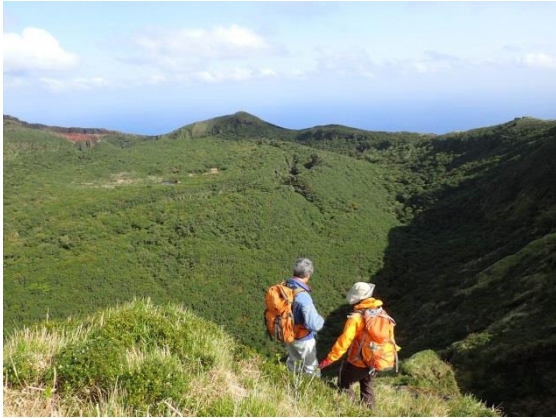
最高地点からお鉢の中を覗く。