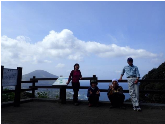
全員集合。Kさん体調不良で登れませんでした；；