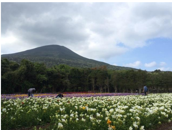
八丈富士とフリージア

登山口(6:50) - 山頂(7:30) - お鉢巡り右回り - 最高地点(8:35) - 山頂(9:00) - 浅間神社(9:10) - 中央火口丘(9:40) - 山頂(10:40) - 登山口(11:00)