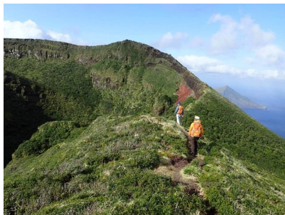
お鉢巡り中。奥には八丈小島が…。