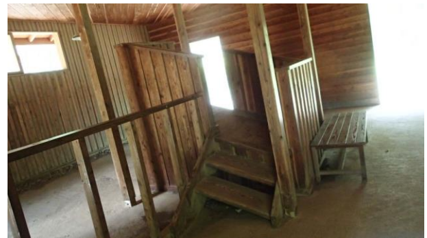
長者の森キャンプ場にある前衛アートの家 わざと傾けて建っている