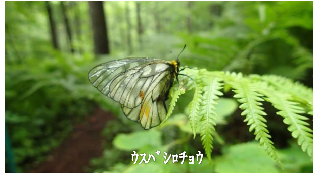
ウスバシロチョウ