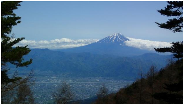
終日表情が違う富士山堪能