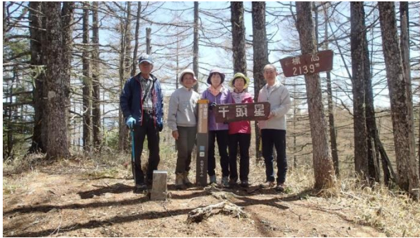
展望無しの千頭星山山頂