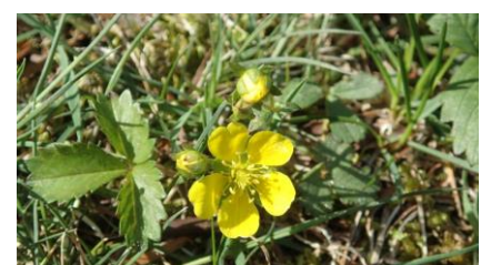
ミツバツチグリを拡大