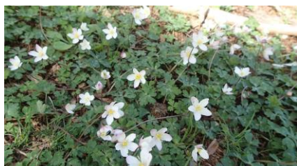
ニリンソウの群生