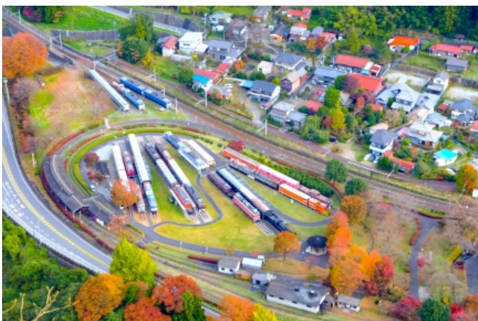
写真1 登山道から見た碓氷峠鉄道文化むら