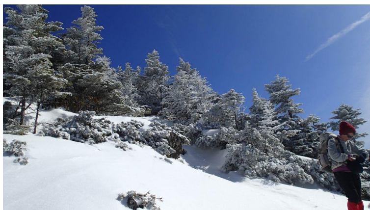
静かでのどかな絶景ポイント