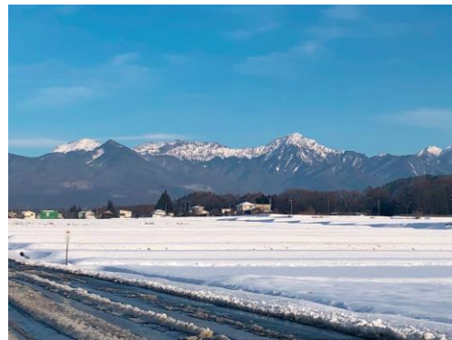
おまけ① 町から見たその日の八ヶ岳 (たしかに山が黒い)