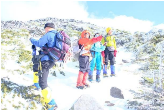
おまけ② なんか絵みたい