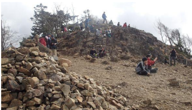
人でにぎわう雷岩 ↓