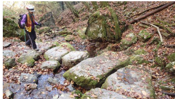
渡渉の度にきれいに並べられている大岩 とっても歩きやすい！