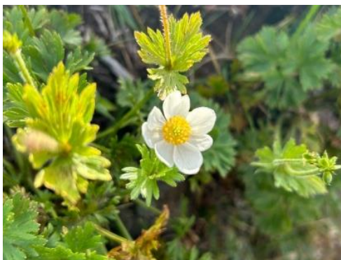
写真5 ハクサンイチゲ