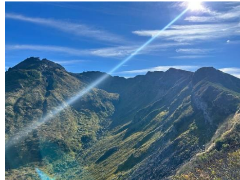
写真4 新山(鳥海山)方面