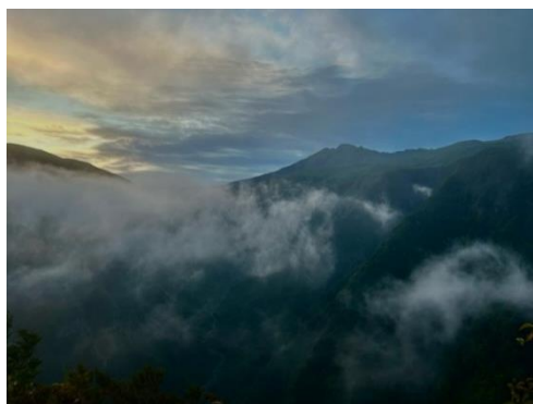
写真1 鳥海山まだまだ遠い

今回初めてのソロ登山ということでペースが分からずにガンガンスピード出して登っていました.しかも他の登山者の方に「早いねー」と煽っていただき私のスピードは加速して行くのでした.さらに,最近1日に10kmは歩いたりたまに走ったりして体力がついている自信があったので調子は良かったです.予定より早く鳥海湖を通過し,ろくに休憩もせずに山頂まで進みました.(写真2)