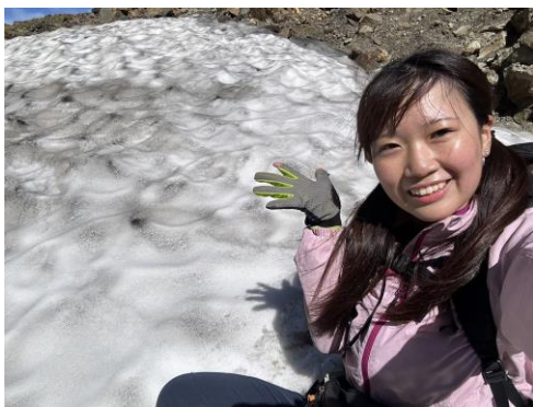
写真7 そろそろ雪が降るんだらうな