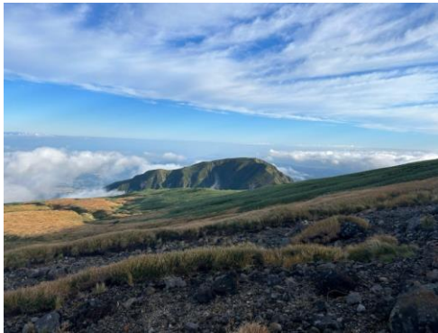
写真3 海～そして晴れてきた