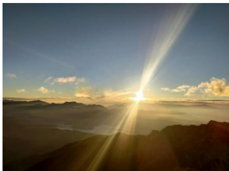
★八方池が雲海に見える★