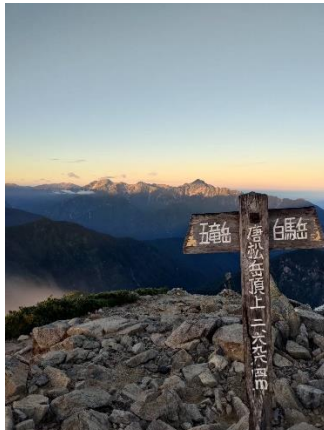
★奥に劔岳。来年行きたい★