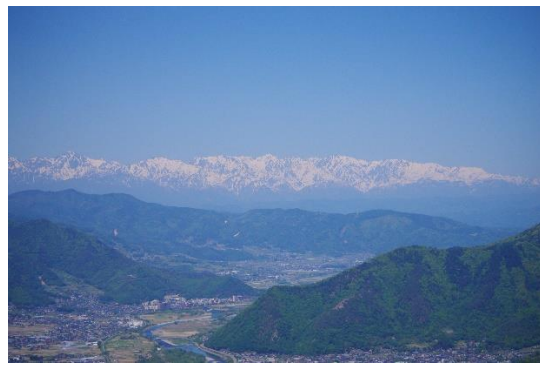
写真6 白馬三山あたり

やっぱり、北アルプスが見えると頑張れる！虚空蔵山に無事登頂し記念にパシャリ(写真7), そこからアップダウンを繰り返して太郎山に登頂しました——！太郎山には赤ちゃんからおじいちゃんまでたくさんの方がいらっしやり市民の山を再認識しました。(写真8)