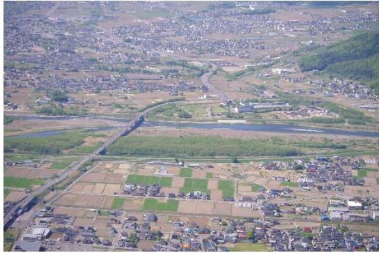
写真3 千曲川と上田平