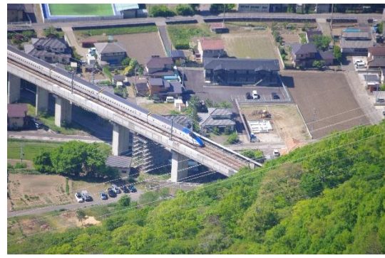
写真4 望遠レンズで新幹線を激写