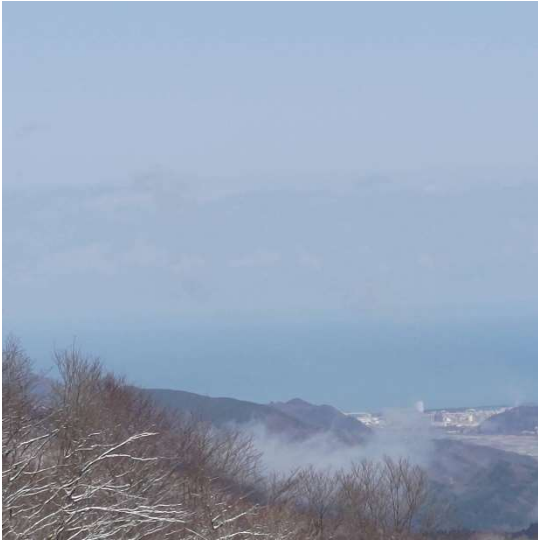
空と日本海の区別がつかない