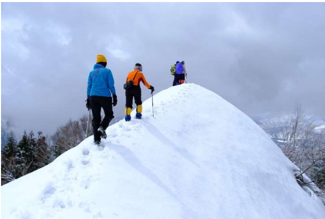
ナイフリッジは慎重に

下山時は2～3組の登山者とすれ違い、きっと我々の踏み跡がお役に立ったことでしょう。スキーやボードの滑った跡もあります。