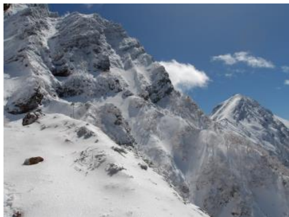
中間のテラスで休憩