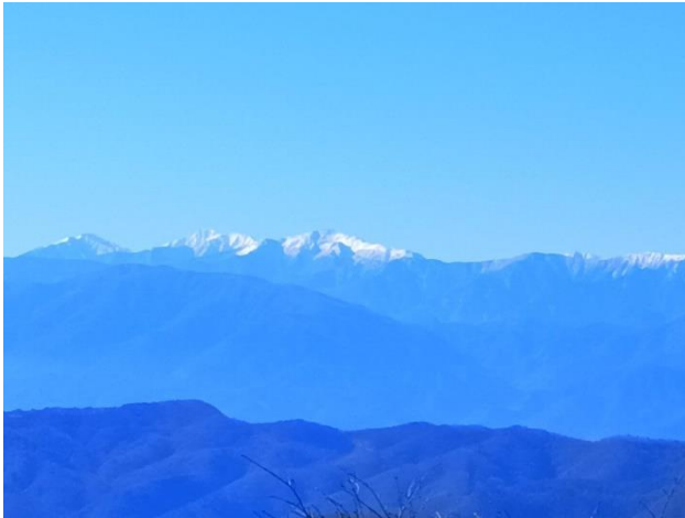
▲ 聖岳～赤石～悪沢 右に白鳳三山 甲斐駒は切れて写って無い